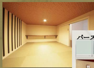
和のアンダーロフト