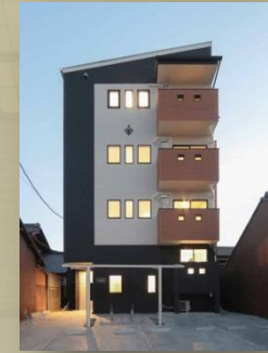
名古屋市中村区 則武1丁目