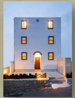
名古屋市中村区 田代町腹池上